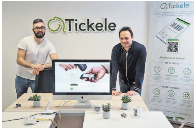
La app de Ricciotti y Carrera contribuye además a preservar el medio ambiente, evitando el derroche de papel.

Propulsada por el programa de aceleración de Abanca con asesoramiento experto y una inyección de 20.000 euros, esta startup con sede en Nigrán pretende conquistar el mercado gallego en el primer semestre del año para, en el segundo, extender sus tentáculos por el resto del territorio español. A punto de despegar, estima desembarcar en comercios y smartphones en febrero, desmaterializando los recibos de compra para que el usuario pueda recibirlos directamente en su teléfono móvil y ahí, almacenarlos