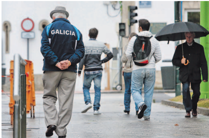
Para poder jubilarse antes de los 65, la pensión generada debe ser superior a la mínima. ALBERTO LÓPEZ

Los afectados llevaron sus casos a los juzgados, y el Tribunal Superior de Xustiza de Galicia decidió elevarlos a la corte de Luxemburgo, para que esta se pronunciasse sobre si la normativa española