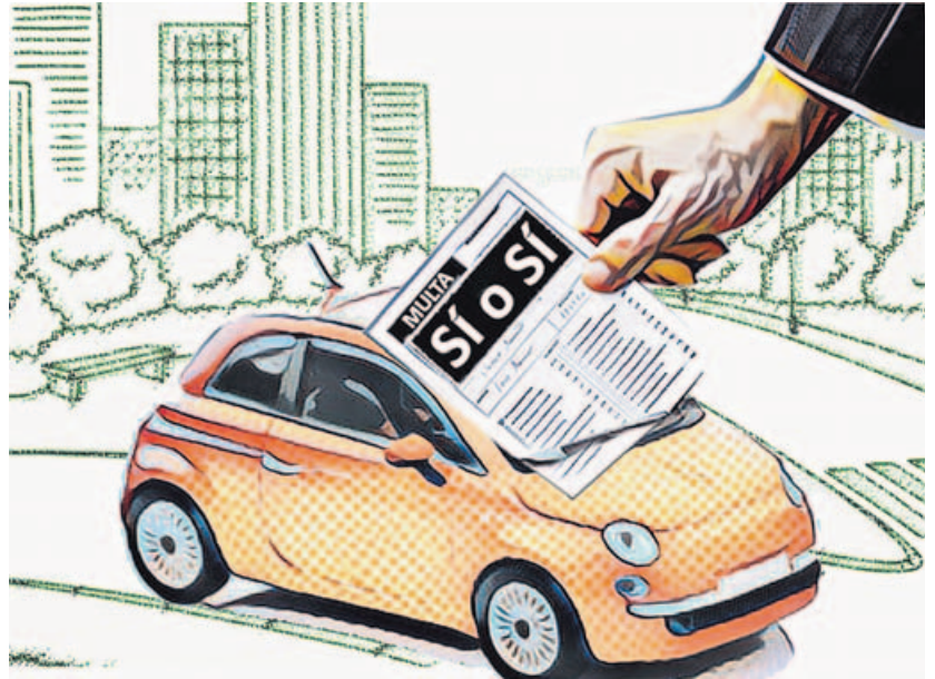
ILUSTRACIÓN MARÍA PEDRELA

Cara de tanto se le quedó al automovilista que aparcó en la ORA, no estaba de acuerdo con la multa porque había pagado, llamó a la empresa concesionaria, le aseguraron que se la quitaban, y un mes después le llegó la sanción desde el Ayuntamiento. Así empezó a deshojar la margarita. «¿La pago, no la pago?». Y, al final aunque pensaba que era injusta, la abonó: 30 euros en lugar de 60, pero sin derecho a recurrir.